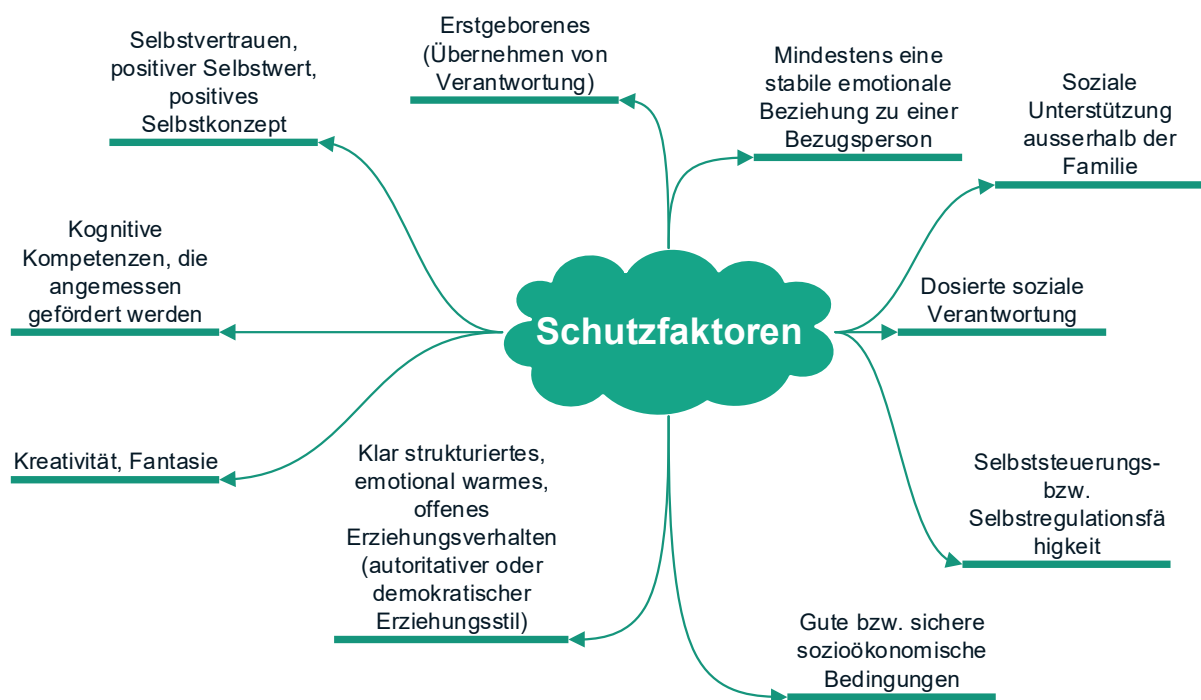
Abbildung 7: Schutzfaktoren

In folgender Abbildung eine Aufzählung weitere Schutzfaktoren 11 gemäss Jutta Becker: