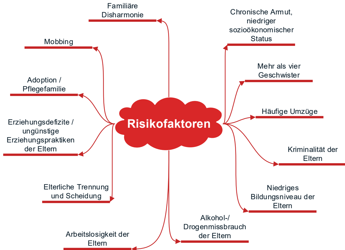
Abbildung 8: Risikofaktoren 13

Unglücklicherweise können traumatische Erlebnisse der Eltern eine Genveränderung hervorbringen, welche einem Kind weitergegeben werden können. So können epigenetische Veränderungen dazu führen, dass ein Kind ein erhöhtes Risiko hat an einer Depression zu erkranken, als wenn es diese Veränderung nicht hätte. Weitere Risikofaktoren 12 sind unter anderem: